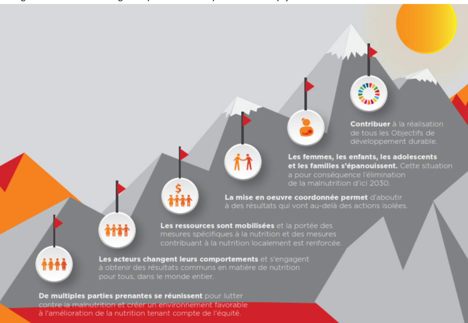
Figure 1 – La théorie du changement pour obtenir un impact au niveau du pays

Grâce à l'aide du groupe consultatif MEAL i , le secrétaire du Mouvement SUN a développé un cadre de travail des résultats qui comprend des indicateurs clés regroupés sous chaque étape dans la théorie du changement.