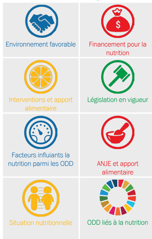
Encadré 1: Huit Domaines Alignés avec la Théorie du Changement

À des fins de simplification pour les comparaisons entre les indicateurs et les pays, les valeurs de chaque pays ont été regroupées en catégories codées par couleur qui représentent un continuum de performance. La classification était basée sur la performance par rapport aux autres pays SUN, sauf lorsque des seuils standards établis sont disponibles (par exemple, l'importance pour la santé publique du retard de croissance des enfants, la prévalence de l'anémie, etc.)