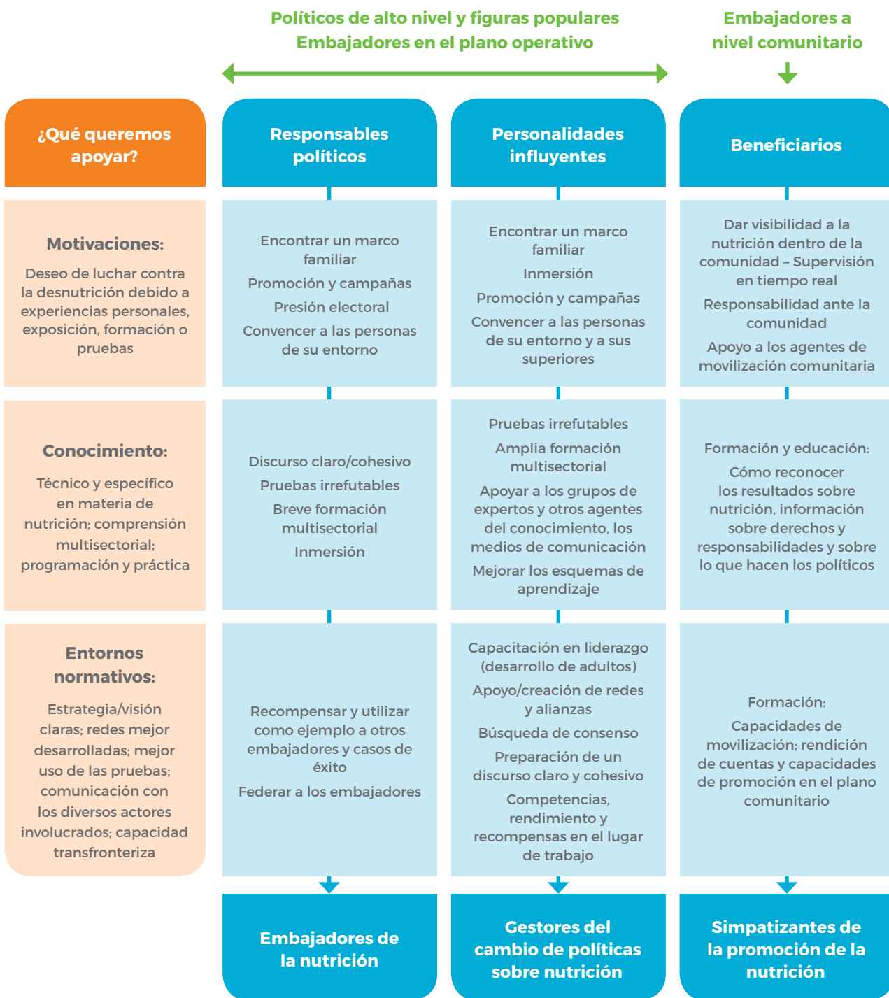
Figura 1: Teoría del cambio para respaldar el liderazgo en la nutrición

a líderes de alto nivel. En Burkina Faso, un miembro del Parlamento se puso directamente en contacto con el presidente para abogar por la creación de una partida presupuestaria dedicada a la nutrición, lo que condujo posteriormente a la creación de una red parlamentaria de nutrición.