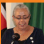
Excm. Sra. Margaret Kenyatta

En Kenia, como en muchos otros países, la primera dama asume el papel de embajadora de la nutrición. De hecho, el 14 de junio de 2016, la Excm. Sra. Margaret Kenyatta presidió en calidad de embajadora la presentación oficial del Informe Mundial sobre la Nutrición en Nairobi, donde pidió más inversiones y leyes para mejorar la nutrición y salvar los obstáculos a la lactancia materna.