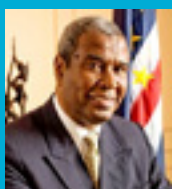
Excmo. Sr. António Mascarenhas Monteiro

El nombramiento de embajadores políticos regionales en materia de nutrición ha demostrado ser una estrategia eficaz para obtener un alto nivel de concienciación. El expresidente de Cabo Verde, el Excmo. Sr. António Mascarenhas Monteiro , fue embajador de la región de África Occidental entre 2011 y 2014, y la antigua primera dama de África del Sur y Mozambique, la Sra. Graça Machel , ha estado fomentando activamente la nutrición y los derechos de las mujeres en los últimos años. Asimismo, el rey Letsie III de Lesoto también ha sido nombrado embajador de la nutrición de la Unión Africana, y 26 países SUN han nombrado oficialmente a embajadores de la nutrición de alto nivel.