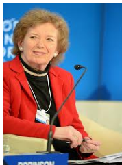
Mary ROBINSON, présidente de Mary Robinson Foundation – Climate Justice