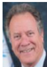
David BEASLEY, director ejecutivo, Programa Mundial de Alimentos