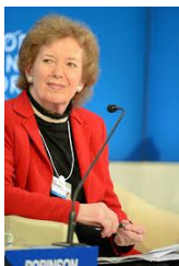
Mary ROBINSON, presidenta, Mary Robinson Foundation- Climate Justice