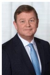
Feike SIJBESMA, presidente ejecutivo, Royal Dutch DSM